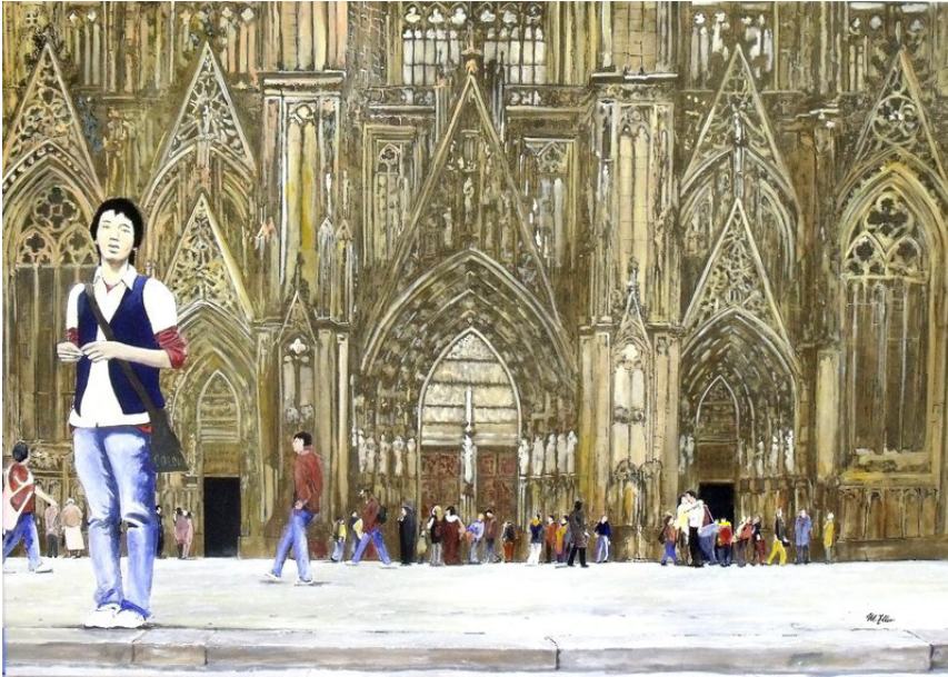
Deutschland. Ein Wintermärchen, Caput IV Knabe mit blauer Weste (Colonia Aggripinensis)

Tempera und Tusche auf Leinwand (H x B) 70 x 100 cm WVZ-Nr. 1882